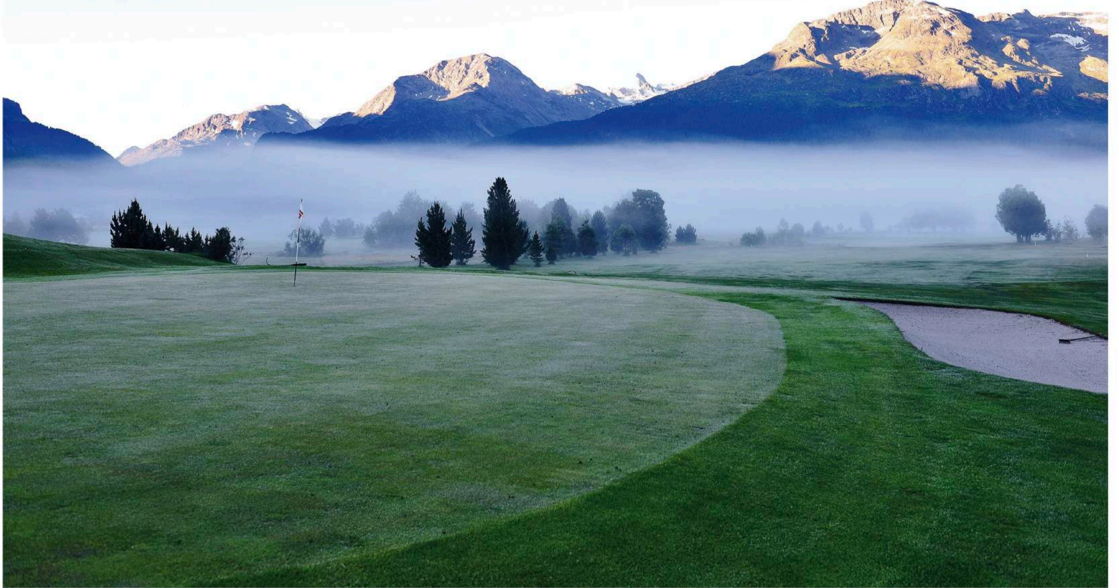
Der ungebrochene Drive der Natur. Golfplatz Samedan, Loch 18, das Ende und der Anfang von allem.