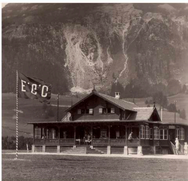
Clubhouse. Der Ort, an dem gesprochen, getrunken, gegessen, erinnert oder vergessen wird.